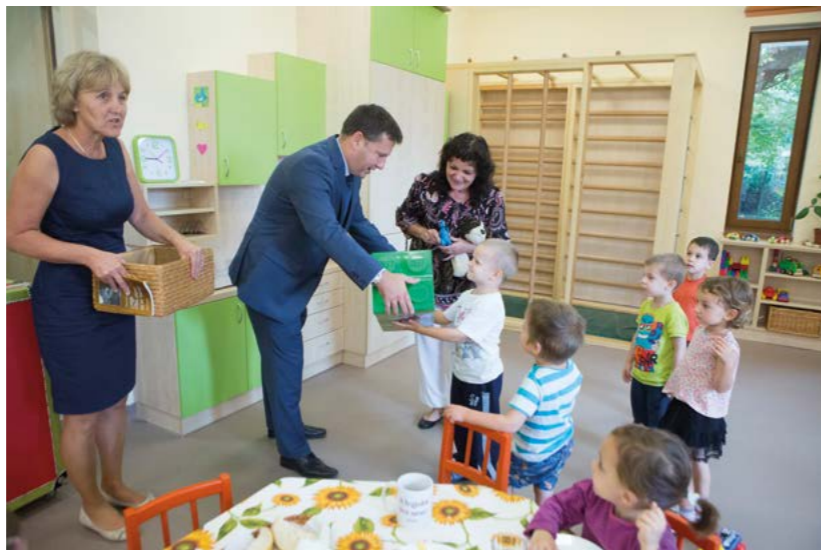
Négyszáz millió forintos beruházással, száz kisgyermek elhelyezésére alkalmas új épületszárnyal bővült a Szemlőhegy Utcai Óvoda

Negatív változásnak tartom ezzel szemben a közéleti munka megbecsültségének hiányát. Úgy érzem, minden korábbinál többen hajlanak arra, hogy a politika szereplőit és munkájukat is eleve gyanakvással kísérik. Abban, hogy ez így alakult, óriási a felelőssége azoknak, akik visszaéléseikkel, vagy mások igaztalan lejárásával adnak táptalajt a legdurvább általánosításoknak. De azoknak, akik általánosítanak, akik felelőtlenül, megalapozatlanul szítják a bizalmatlanságot, tudniuk kellene, hogy közösségük és önmaguk ellen tesznek, mert megnehezítik, olykor ellehetetlenítik a legnehezebb lakossági feladatok elvégzését. És nagy a felelősségük azért is, mert elveszik az emberektől az elért eredmények öröme. Régebben egy-egy beruházást, fejlesztést a legtöbbször meglepéssel fogadtak, sajátjuknak érezték. Napjainkban sajnos sokan arra összpontosítanak, hogy mit kifogásolhatnak, támadhatnak egy-egy intézkedésben, valamint hogy kifürkészék, vajon kit és milyen önös érdek vezérelhetett a döntésben. Az ilyen hozzáállás sehová sem vezet. Én változatlanul hiszek a civil közösségek erejében, de azt vallom, hogy konstruktivitás, értékteremtés csak együttmű-