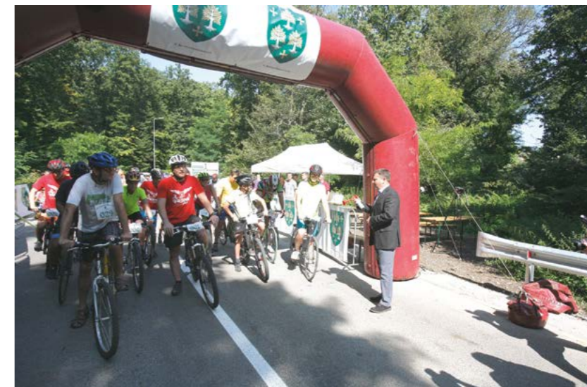
Az Önkormányzat saját beruházásában, 300 millió forintért újjáépítette a Szép Juhász utat

Tíz évvel ezelőtt, a beiktatásomkor mindenekelőtt arra gondoltam, hogy méltónak kell lennem a megtiszteltetésre, ami ért. A választópolgárok azóta két alkalommal erősítették meg polgármesteri tisztségemben, sőt 2011-ben országgyűlési képviselővé is megválasztottak. A felelősségérzet, amelyre az elnyert bizalom kötelez, azóta sem csökkent bennem. Máig ez jelenti munkám erkölcsi alapját, s indít arra, hogy szűkebb pátriámban újabb és újabb feladatokra, kihívásokra találjak megfelelő megoldásokat.