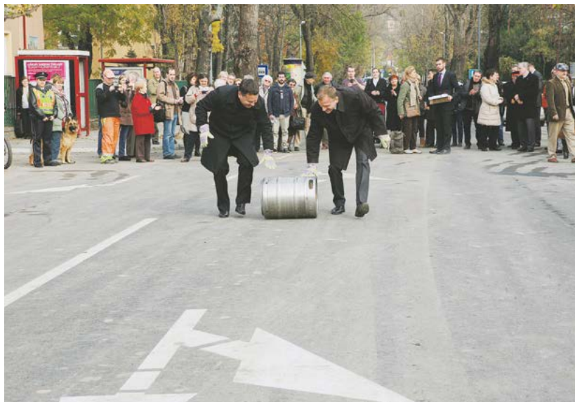
Hordógurítás a Kelemen László utcai híd avatásakor

Fővárosi képviselőként javasoltam a városvezetésnek, hogy a jövő évtől változtassanak azon a több évtizedes gyakorlaton, hogy minden közműszolgáltató, illetve magáncég akkor bonthatja fel az utakat, amikor akarja. Az így keletkező káoszról alakulnak ki a több kilométeres dugók. Reményeim szerint 2016-tól egységes